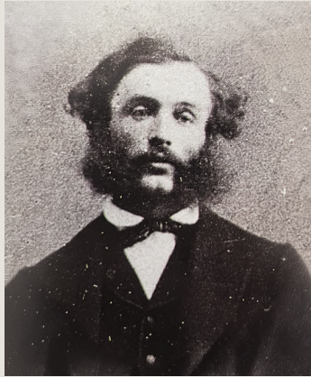
Anton Thaler, 1866